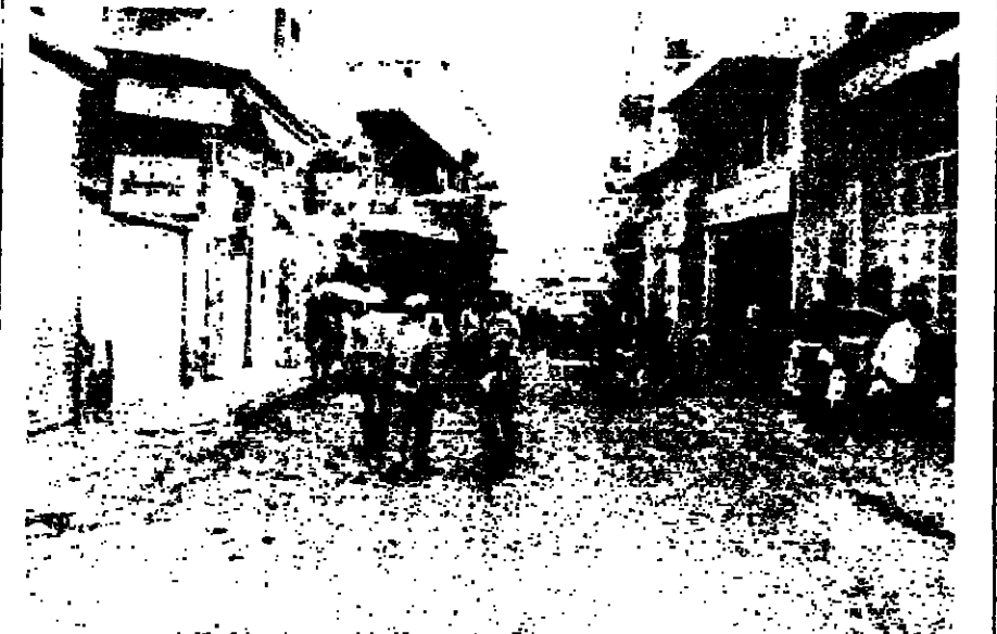
رجال الاسن في شارع الشاعرة